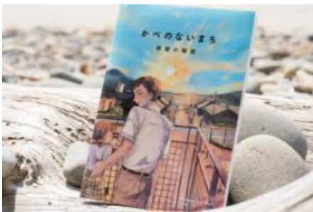
絵本「かべのないまち 希望の物語」

大漁旗デザインの手ぬぐい、女川の「やすらぎ」と「力強さ」がテーマのドリップコーヒー、大漁旗柄や女川町のマスコットがデザインされたタオルハンカチ、女川産の銀鮭・帆立のふりかけを贅沢に詰め込みました。