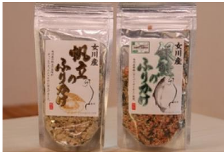
女川産帆立と銀鮭のふりかけセット

魚の街女川から、簡単に食べられるお惣菜をお届けします。【商品内容】いかと海老と野菜のアヒージョ、いかのガーリックバター醤油味、鮭ハラスのおろしポン酢