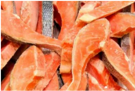
訳あり銀鮭 切身 約1.5kg