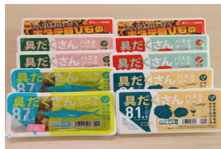
具だくさんパスタソースとホタテのガリバタ醤油セット

女川の美味しい季節の地魚を4種セットでお届けします。新鮮なうちに加工しているので、お刺身でも美味しくお召し上がりいただけます。四季の変化をお楽しみください。