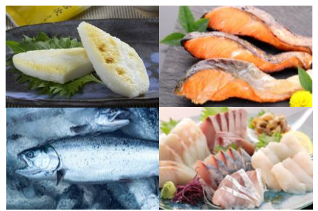
【定期便】大定番！女川の水産加工品セット 全4回

細胞を壊さない「CAS凍結」という方法で凍結された貝柱は、解凍してもドリップが少なく旨味も逃げません。お刺身やバターソテーなど贅沢に楽しめます。