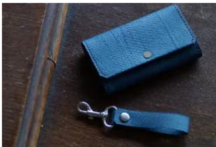
女川産銀鮭レザー カードケース/キーホルダーセット(色:縹・深碧・錆)

女川産銀鮭のレザーを使用したコースターは、銀鮭の鱗模様や魚が持つ特殊な感覚器官「側線」の模様も浮かび上がります。マグカップでも使用しやすいサイズです。縹・深碧・錆の3色セットをお届けします。