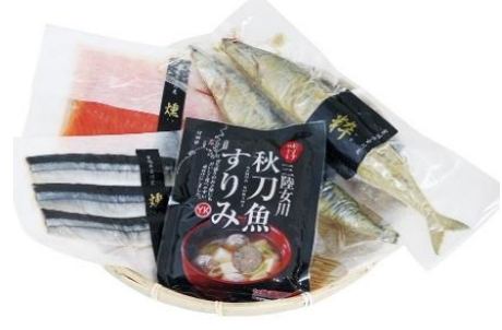
女川産養殖銀鮭とさんま加工品セット

水産加工などを通し障がい者自立支援事業を行う「NPO法人きら女川」のしゃぶしゃぶわかめとあぶりさんまのセット！わかめの組織を破壊せずに、生のまま冷凍保存しています。熱湯で10秒茹でて冷水でしめると、たちまち旬のわかめの風味や食感が味わえます。