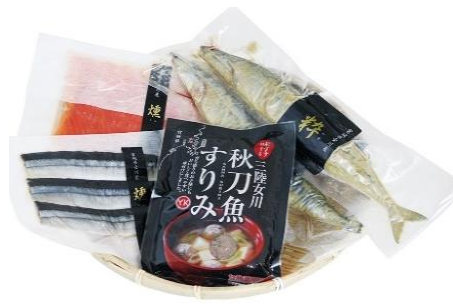
女川産養殖銀鮭とさんま加工品セット

銀鮭養殖が盛んな女川町。女川町で水揚げされる銀鮭は脂がしっかりとって臭みもありません。水産加工会社「マルキン」が手掛けるブランド養殖銀鮭「銀王」の魅力を味わっていたただける商品です。