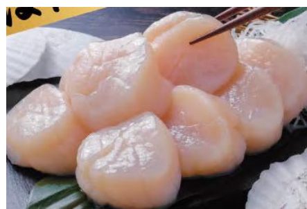
冷凍ほたて貝柱(生食用)厳選のプレミアムサイズ 500g/CAS凍結

女川に拠点を置く水産加工会社「鮮冷」のパスタソースと、4種とホタテ貝もガリバタ醤油のセットをお届けします。パスタに和える・お酒のおつまみ・おかずの逸品など様々な食事シーンでお楽しみいただけます。