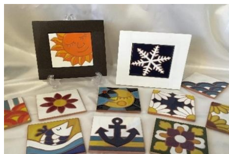
みなとまちセラミカ工房 メモリアルタイル体験教室

「みなとまちセラミカ工房」でひとつひとつ丁寧に手づくりされた干支のスペインタイル。木製のフレーム、イーゼルが付いてくるので、インテリアとしてお楽しみいただけます。 ※2026/10/31まで受付中