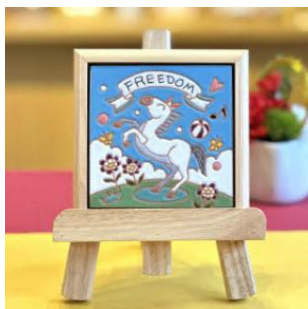
スペインタイル(干支絵) 木製フレーム・イーゼル付き

「NPO法人みなとまちセラミカ工房」から、女川の街並みを明るく彩るスペインタイルのマグネットをお送りします。カラフルな色づかいの美しさは気持ちを明るくし、生活に彩りを与えてくれます。