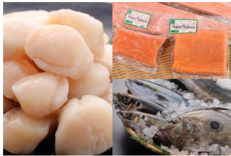
帆立貝柱生食用、女川産養殖銀鮭お刺身用と季節の地魚3種詰合せ

魚の買い付けから最終製品まで自社で行う「高政」の笹かまぼこ詰合せ。製造するかまぼこは希少価値の高い三陸沖産の吉次を贅沢に使用しています。