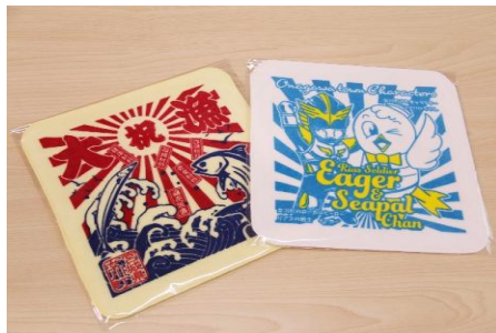
オリジナルタオルハンカチ 2枚組

海の町女川町ならではの、大漁旗をモチーフにしたオリジナルの手ぬぐいです。女川の代表的な魚であるサマなどが描かれています。