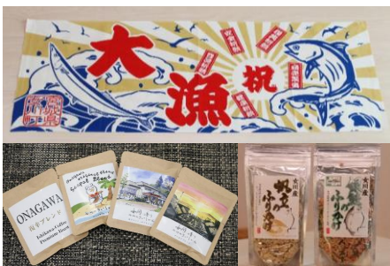
大漁旗手ぬぐいセット

大漁旗をモチーフにしたデザインと、女川町のマスコット「シーバルちゃん」と女川町のヒーロー「イーガー」がデザインされたタオルハンカチの2枚セットです。