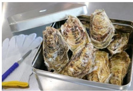
潮香焼セット(殻付き牡蠣・カンカン焼き)

宮城県産の旬の天然ひらめと、天然ひらめを使ったひらめ昆布酢、そして天然真鯛、養殖銀ざけをお刺身にスライスして、リキッドフリーザーで急速冷凍しました。生と変わらぬ美味しさ・食感をお楽しみください。