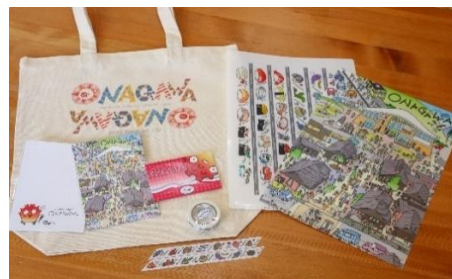
カフェ・ごはん・セボラ オリジナルグッズセット

女川町初のデザイン会社「女川アートギルドカンパニー」の革コースター。普段の生活での使い勝手にこだわったコースターです。「日常に女川のものを置いてもらいたい」という思いから作られました。