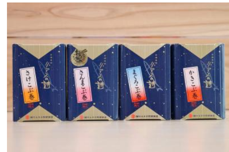
リアスの詩 昆布巻きハーフサイズ4種セット

女川の手作りの味を届ける「マルキチ阿部商店」の魚の昆布巻「リアスの詩」。具材はもちろん、昆布、お酒、醤油にもこだわっています。ひとつひとつに愛情を込めた手づくりの味を、ぜひお召し上がりください。