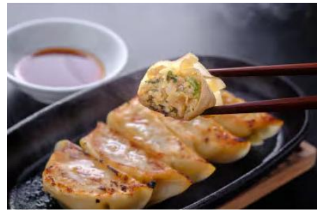
三陸産ほたてを使ったくぼたてガーリック餃子12個入×3パック

女川産のホタテやブランド銀鮭「スーパーサーモン」の美味しさが手軽に味わえるふりかけのセットです。どちらも女川でしか手に入らない商品です。