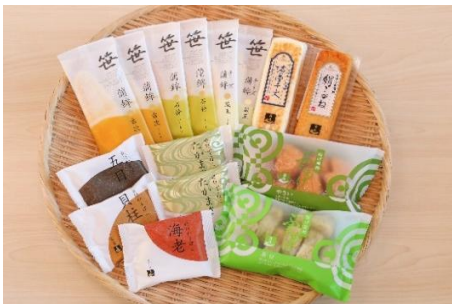
笹かまぼこ詰合せ 11種

さんま・銀鮭など、鮮魚、水産加工品の販売を行う「ワイケイ水産」の養殖銀鮭とさんま加工品をセットにしました。臭みがでないように加工された味付さんまのすり身は食べやすく、子どもにも大人気の味です。