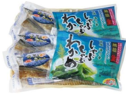
しゃぶしゃぶわかめとあぶりさんま