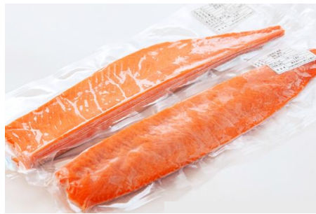
養殖銀鮭「銀王」刺身用サク2本

山と海の豊かな自然の恵みをうけ、大切に手間をかけて育てられた銀鮭をご堪能ください。使いやすい切身でお届けします。甘塩に仕上げましたので、お子様や塩分摂取が気になる方にもお楽しみ頂けます。