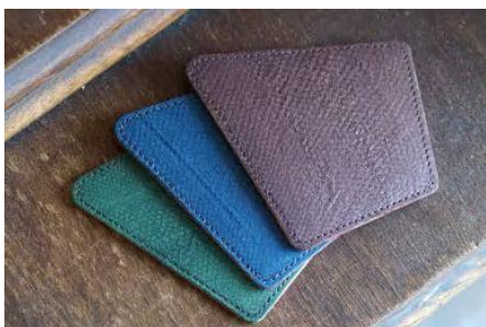
女川銀鮭レザーのコースター 3点セット

女川町の特産品である養殖銀鮭の「皮」を活用した「フィッシュレザー」製品。「Dear Fish」は女川町発のフィッシュレザーブランドです。銀鮭の皮の繊細な鱗模様が織りなす美しいレザー製品を、ぜひお楽しみください。