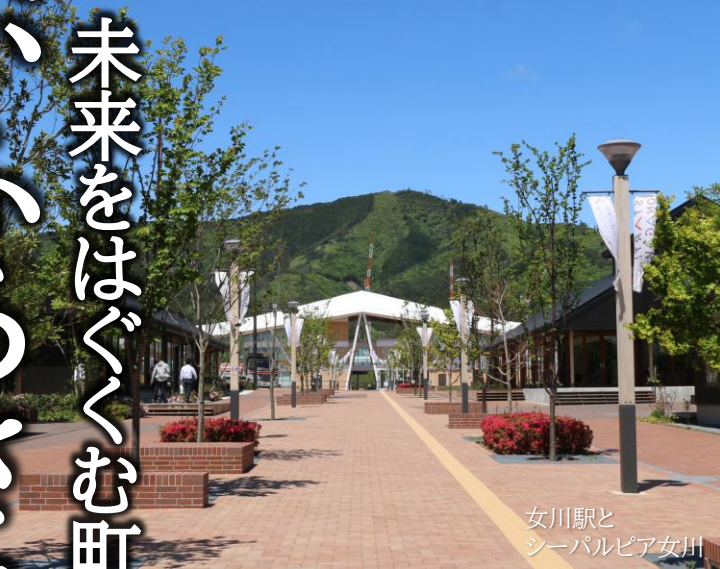
女川駅と シーパルピア女川