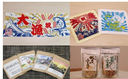
女川よくばりセット

大漁旗柄と女川町のマスコットがデザインされたタオルハンカチ2枚組、女川の「やすらぎ」と「力強さ」がテーマのドリップコーヒーセット、女川産の銀鮭・帆立のふりかけの詰め合わせをお届けします。