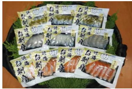
近海お刺身詰合せ

宮城県内で獲れた三陸産ほたてに豚肉・野菜の入った具だくさんの餃子です。夏は焼いてスタミナ回復に、冬はお鍋やスープに入れても美味しいいただけます。