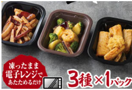
お魚の総菜 レンチン簡単3種セット

多くの水産加工会社が拠点を構える女川町では、多彩な水産加工品が作られています。日々の食事に寄り添うおかずから、お酒に合うおつまみまで、様々なシーンで女川町の魅力をお楽しみください。