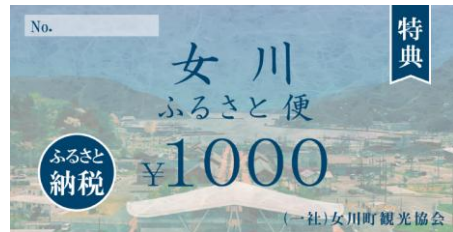
女川町ふるさと便 12,000円分

銀鮭刺身用サクと帆立貝柱、季節の地魚をセットでお届けします。水産の町女川でとれる美味しい魚介類を新鮮なうちに加工。ぜひお刺身でお楽しみください。