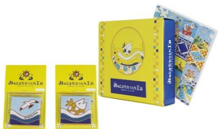
スペインタイルマグネット

カラフルで装飾に富んだスペインタイル。震災後、地元有志によって女川町内に工房がオープン。現在では町内各所にタイルが飾られており、震災復興のシンボルとして町を明るく彩っています。