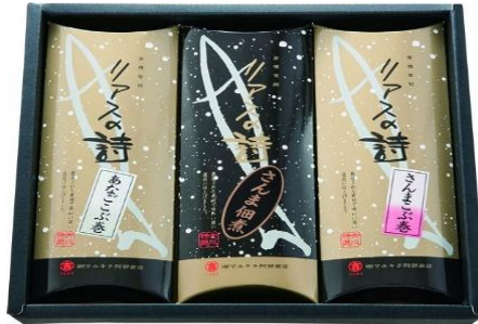
リアスの詩セット

ヤマホングループの水産加工部門「ヤマホンパイフーズ」の水産加工品のセットです。お刺身用銀鮭の切り身に加え、さんま加工品(黒酢煮、寒風干し、小桜そぼろ)をお届けします。様々な味をお楽しみください。