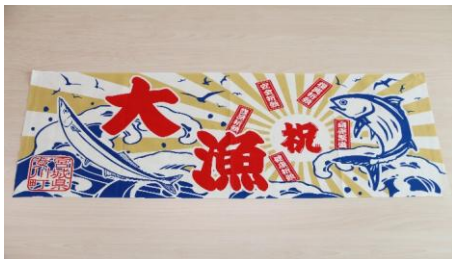
オリジナル大漁旗手ぬぐい

港町女川らしい、大漁旗柄の手ぬぐい・タオルハンカチや、町内の飲食店や企業がオリジナルで制作したコースター・文具等を取り揃えております。日常に、手軽に、女川らしさを取り入れてみませんか。