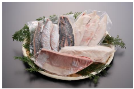
季節の地魚4種詰合せ

火にかけるだけで手軽に殻付き牡蠣をお楽しみいただける潮香焼(カンカン焼)のセットです。ご家族、ご友人などでお楽しみください。※牡蠣ナイフと軍手が入っています。