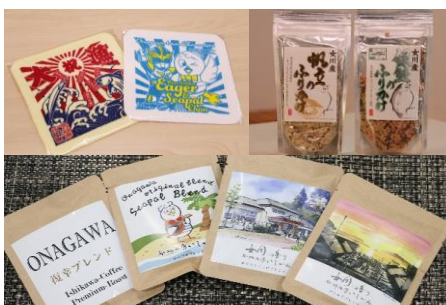
タオルハンカチセット

このふるさと応援寄附でしか手に入らない大漁旗モチーフのオリジナル手ぬぐいと、女川の「やすらぎ」と「力強さ」がテーマのドリップコーヒーセット、女川産の銀鮭・帆立のふりかけの詰合せをお届けいたします。