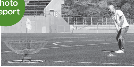
◆ターゲットバードゴルフはおとなも夢中になりました