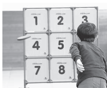
◆ディスクで的を狙うディスクゲッター。当たれ!

さんの歌やボリウッドダンスの華麗な踊りを披露、また、サリーの着付け体験やインド発祥のおはじきゲーム「キャロム」も好評でした。女川町とインドの関係は、震災後にインドレスキュー隊46名が本町での捜索活動をして以来、交流が続いています。