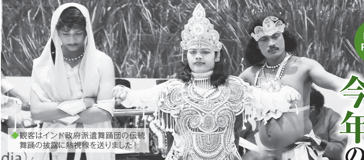
◆観客はインド政府派遣舞踊団の伝統舞踊の披露に熱視線を送りました!