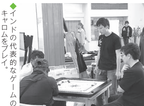
◆インドの代表的なゲームのキャロムをプレイ。

「ナマステ・インディア」とは、東京・代々木公園を会場に、2日間で20万人を超える参加者を集めるインドと日本の文化交流イベントです。その「ナマステ・インディア」を5月3日、4日に「ナマステ・インディア in 女川町」としてまちなか交流館で開催されました。インド政府派遣舞踊団、インド人演歌歌手チャダ