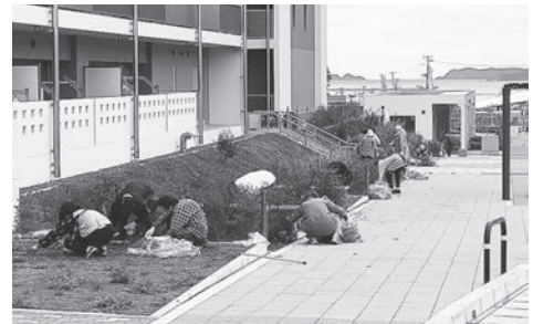
◆ご協力をお願いします！

※なお、当日雨天等により中止となった場合は、翌週の日曜日(令和元年6月16日)に実施いたします。