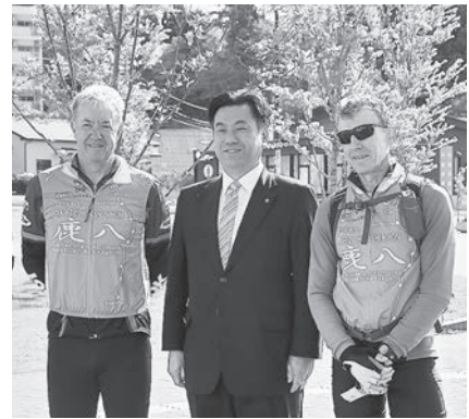
◆オーストラリアの方も走られました。

自転車一年に一度は、被災地を訪れることで復興支援をすることを目的とした、ツール・ド・東日本鹿嶋to八戸800km。この自転車イベントでは、令和の初日を女川町で過ごしていただき、翌2日に女川駅前を出発し、気仙沼市まで移動しました。このイベントの参加費の一部は、被災地の中学生をオーストラリアに招待する事業に活用され、本町の中学生をオーストラリアに招待していただいています。