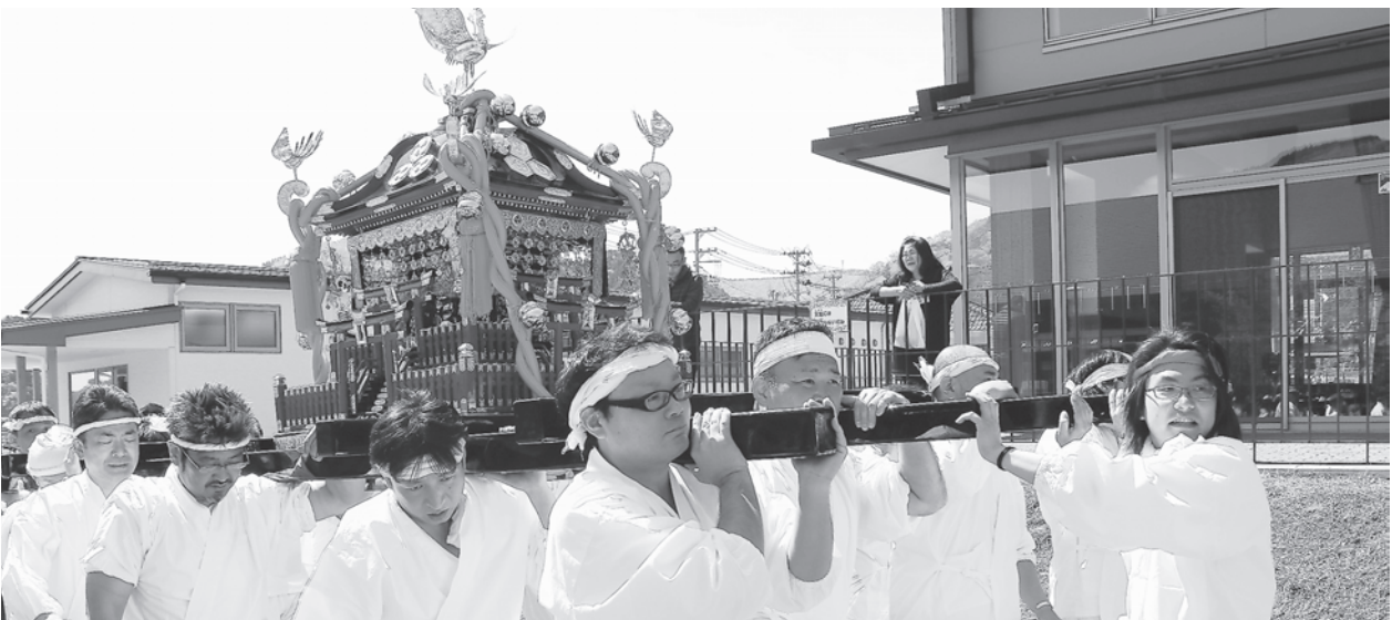
◆大人たちも町内を練り歩きました。

今年、東日本大震災で破損、資金不足で修復されていなかった白山神社の子ども神輿がサツポロホールディングス(株)から特定非営利活動法人アスヘノキボウを通じた寄付金(恵比寿麦酒祭りビール売上金相当額の一部)の支援により、本神輿と一緒に町内を巡行することができるようになり、子どもの笑顔が戻り、女川地区の希望とコミュニティの場として復活しました。