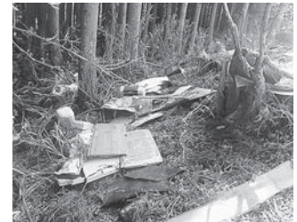
◆不法投棄されたごみ

環境月間中は、不法投棄問題にも全国的な取り組みが行われています。不法投棄は環境等の破壊にもつながるため、自然豊かな町を未来に継承するためにもしてはいけません。最近、生活ごみや廃棄物の不法投棄が後を絶たず、町では宮城県と協力しながら不法投棄巡回パトロール等を実施しており、発見した場合にはただちに警察に通報し、捜査していただいています。不法投棄は法律で禁止され、罰則規定として個人は5年以下の懲役または1千万円以下の罰金、法人では3億円以下の罰金とされています。町民一体となって、「しない」「させない」「許さない」という意識を持ち、不法投棄をなくしましょう。