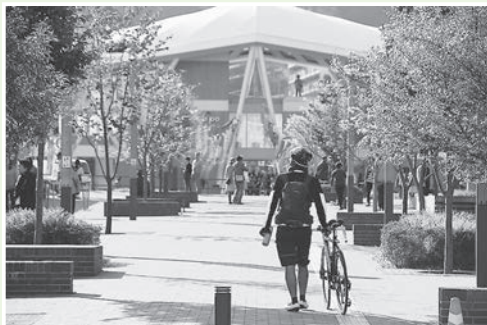
▲5月取材のベストショット!! Twitterでも町の情報を発信しています。

次回予告風に編集後記を書き始めてみました。以前、広報担当だった方に「思ったことを口に出して、それを文章にするんだ」とアドバイスを頂きました。広報を作成するときいつも心にとめ、7月号の作成に向け、取材に出かけます。(佐藤)