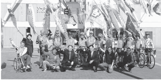
◆出発前の記念撮影④出発の様子⑤