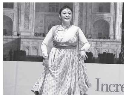
◆日本人のインド舞踊家。見事な踊りでした。

「ナマステ・インディア」とは、東京・代々木公園を会場に、2日間で20万人を超える参加者を集めるインドと日本の文化交流イベントです。その「ナマステ・インディア」を5月3日、4日に「ナマステ・インディア in 女川町」としてまちなか交流館で開催されました。インド政府派遣舞踊団、インド人演歌歌手チャダ