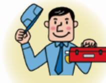
危険が伴う箇所の点検は専門の事業者さんに依頼を

※キッチンやお風呂などの住宅設備については、一般社団法人リビングアメニティ協会 ( http://www.alianet.org/ ) が不具合や異常の有無を簡単にチェックできるツールをサイトで公開していますので、そちらも参考にしてください。