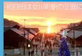
初日は女川町駅の正面に