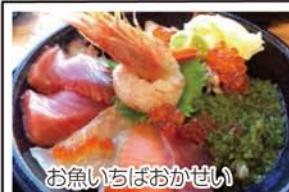
お魚いちばおかせい