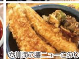
女川海の膳ニューこのり