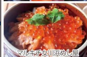
マルキチ女川浜めし屋