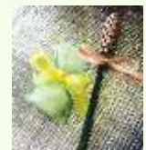
▲ ラベンダーの花穂を乾燥させ、バンドルズやポプリもできます