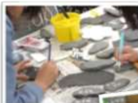
▲ 河原の石にアクリル絵の具で名札描きをしました