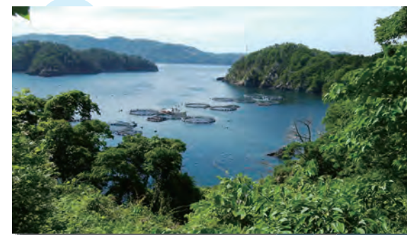
出島遺跡からの景色