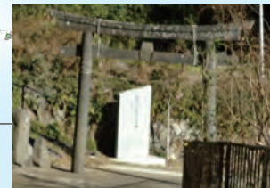
女川のいのちの石碑 (寺間地区)