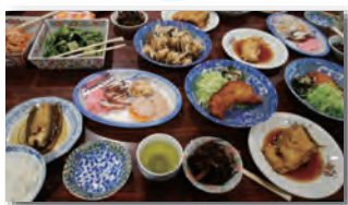
地元食材を使った料理