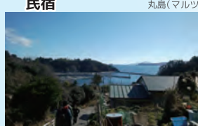
民宿いずしまから見える金華山