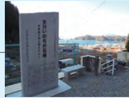
女川のいのちの石碑 (出島地区)