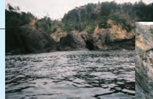
空窟洞 (ソラクツボラ)