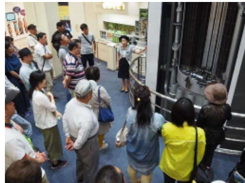
原子力発電の説明 →