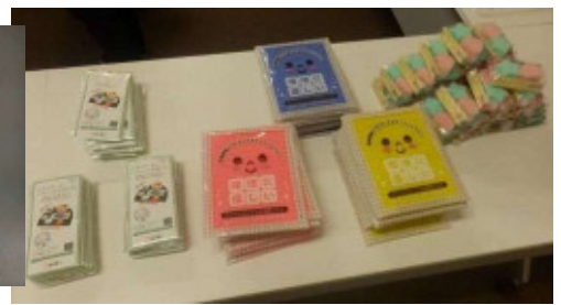
14:50～ マスカー会議室にて“ふりかえり”～解散（下段:おみやげ）