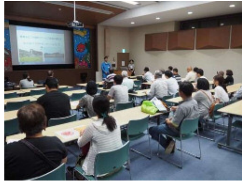
PRセンターでの全体説明 ↗