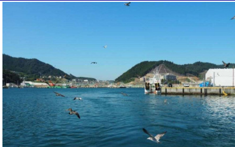
9:20～10:45 女川湾クルーズ まちを海から見る