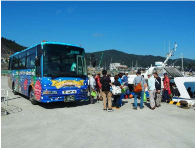
9:15～ バスから船へ乗り込み、 観光協会、役場から主旨説明